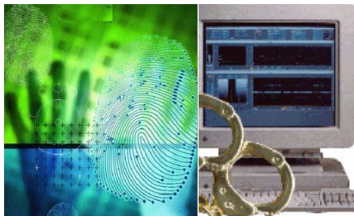
Slika 68. Kriminal na mreži

Spisak krivičnih djela koja se mogu počiniti zloupotrebom Interneta je prilično velik.